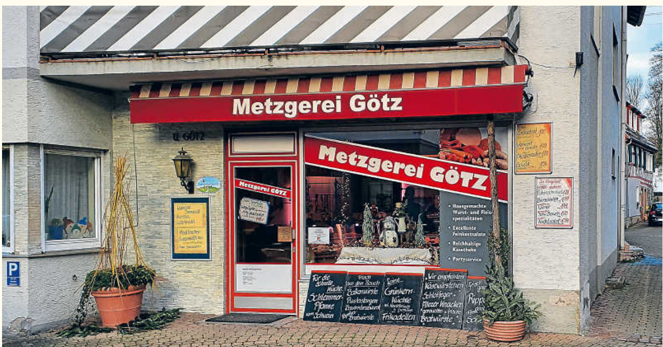
Ende der 1960 Jahre entstand das neue Ladengeschäft mit Wohnhaus, dem später auch noch eine moderne Wurstküche angegliedert wurde