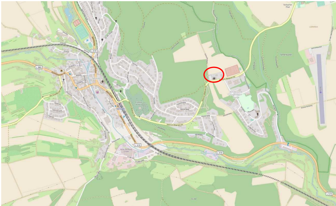
Abb. 1: Auszug aus OpenStreetMap