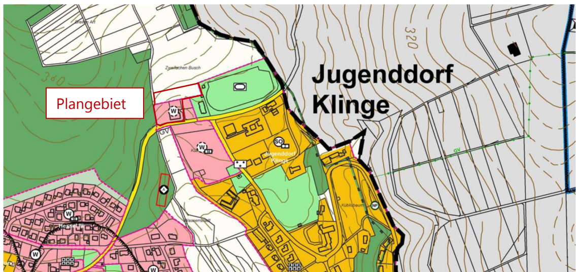
Abb. 3: Auszug aus dem Flächennutzungsplan

Die Planung folgt demnach nicht vollständig dem Entwicklungsgebot nach § 8 Abs. 2 BauGB. Der Aufstellungsbeschluss zur Änderung des Flächennutzungsplans wird am 15.02.2023 gefasst. Das erforderliche Verfahren wird im Parallelverfahren nach § 8 Abs. 3 BauGB durchgeführt.