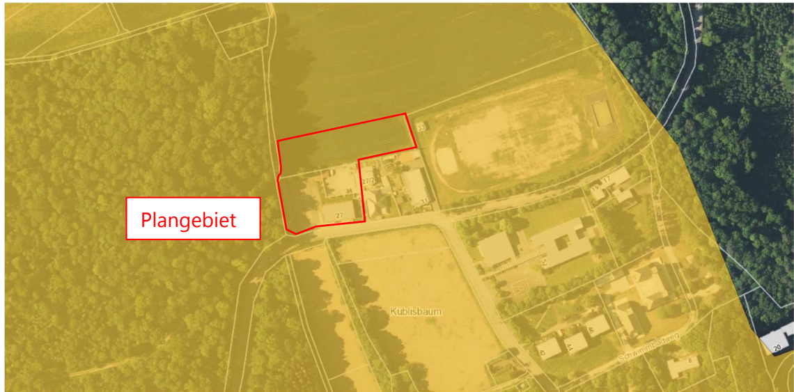
Abb. 4: Schutzgebiete

Von der Planung werden die folgenden Schutzgebietsausweisungen nach dem Naturschutz- oder Wasserrecht berührt: