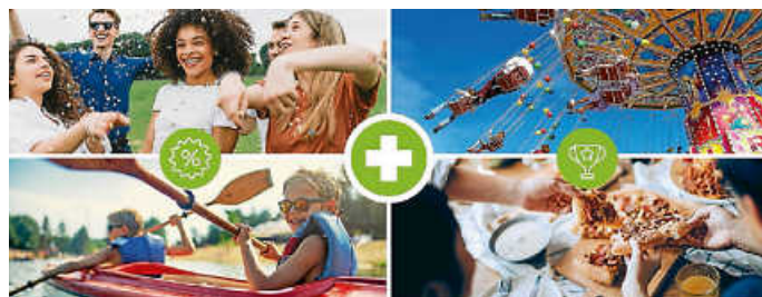
Werde Teil unserer Community und folge dem Nussbaum Club auf Social Media Grafik: Nussbaum Club

Habt ihr schon vom Nussbaum Club gehört? Das kostenlose Vorteilsprogramm exklusiv für unsere Abonnenten bietet euch unzählige Möglichkeiten zu sparen, zu gewinnen und das Beste aus eurer Freizeit zu machen. All diese Vorteile könnt ihr auch auf unseren Social-Media-Kanälen entdecken! Warum dem Nussbaum Club auf Social Media folgen? Immer bestens informiert: Erhalte die neuesten Updates zu unseren laufenden Aktionen direkt in deinem Feed. Exklusive Einblicke: Sei der Erste, der von neuen Aktionen rund um Coupons, Rabatte und Gewinnspiele erfährt. Noch mehr sparen: Nutze die Chance auf großartige Ersparnisse bei deinen Lieblingsaktivitäten und Einkäufen. Mitmachen und gewinnen: Nimm an abwechslungsreichen Gewinnspielen teil und sichere dir fantastische Preise! Also, verpasse künftig nichts mehr und folge uns auf Facebook und Instagram.