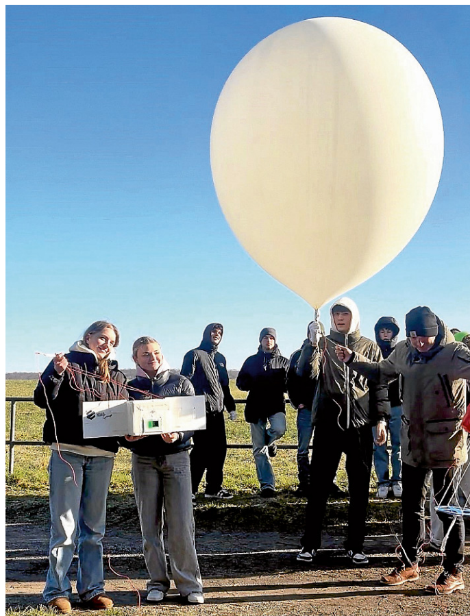
Aufstieg des Wetterballons

Wir freuen uns auf weitere wissenschaftliche Abenteuer und hoffen, dass unser Wetterballon-Projekt als Inspiration dient und zum Nachmachen anregt. (Text: Maya Bertog, Ester Hausch)