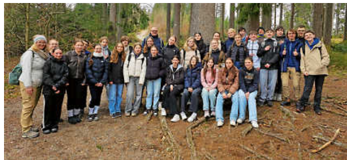
Wald ist um Dünkirchen nicht vorhanden. Ein Ausflug der deutsch-französischen Reisegruppe in den Schwarzwald war ein Muss.