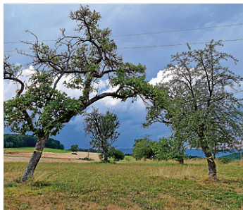
Das Ernteprojekt „Gelbes Band“ setzt sich für einen achtsamen Umgang mit Lebensmitteln ein.

Im Sommer und Herbst freuen wir uns über eine reiche Ernte von Kirschen, Zwetschgen, Nüssen oder Äpfeln. Doch nicht alle Früchte können immer von den Besitzern der Obstbäume geerntet werden. In der Folge verderben an und unter Obstbäumen jährlich Unmengen an Obst, das andere gerne gegessen hätten. Um der Lebensmittelverschwendung hier entgegenzuwirken und die Wertschätzung für unsere regionalen, saisonalen Produkte zu fördern, beteiligt sich der Neckar-Odenwald-Kreis erneut an der Ernteaktion „Gelbes Band“.