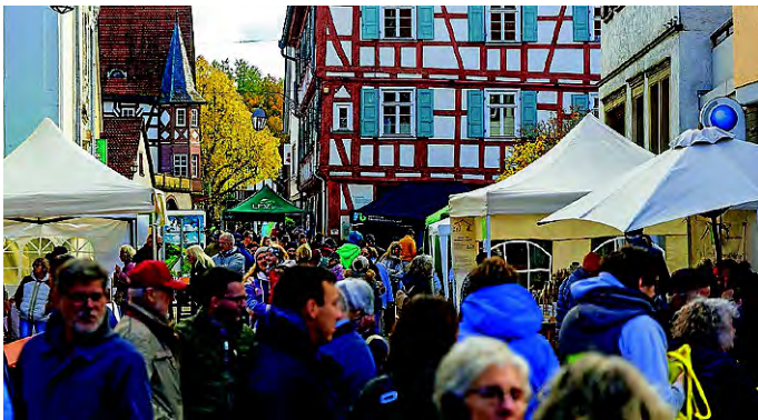
Text und Fotos: Kevin Retlich