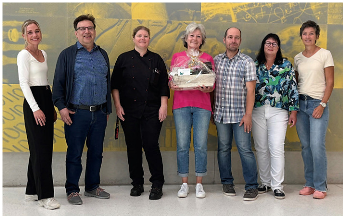
Gewünscht „kleiner Bahnhof“ zur Verabschiedung

Ihren Abschied wollte die nunmehrige Ruheständlerin bewusst ohne großes Aufsehen gestalten. Das Eckenberg-Gymnasium wünscht ihr für den neuen Lebensabschnitt alles Gute, Gesundheit und viele erfüllte Jahre in ihrer Wahlheimat im Landkreis Würzburg.