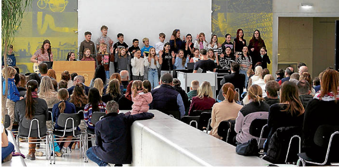
Bildunterschrift: Musikalischer Gruß an die neuen Mitschüler? Der Chor der Klassen 6 sorgte für gute Stimmung. (Text, Foto: jpw)

Nähere Informationen hierzu gibt es auf der Schulhomepage: ebg.schule