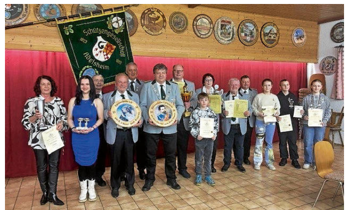
Die Pokal- und Ehrenscheiben-Gewinner 2026