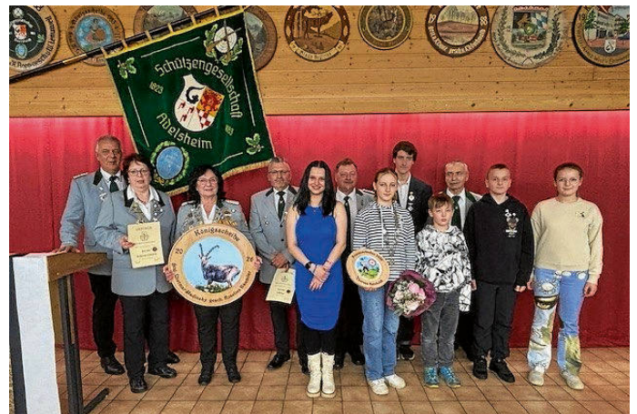
OSM Schönfeld mit der neuen Schützenkönigin mit Gefolge und den Jugendprinzen

Unter dem tosenden Applaus der Festgesellschaft nahm die sichtlich gerührte neue Schützenkönigin die Königsscheibe, die Königskette, die Ernennungsurkunde-Urkunde und ein prächtiges Blumenbukett entgegen. Applaus und Gratulationen – „Hurra“- und „Gut-Schuss“-Rufe – beschlossen den offiziellen Teil dieses denkwürdigen Festabends, der noch lange nicht endete.